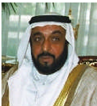
シェイク・ハリファ・ビン・ザーイド・アル・ナヒヤン UAE 大統領

石油産油国も含め、原子力の平和利用開発に関心を示すアラブ諸国が多くなってきたという実情にこの宣言は照応している。先進国の中でも、米国・英国・フランス・ロシアは、アラブ諸国のこうした傾向を後押ししており、核施設を建設する商業的な契約をこれら先進国とすでに結んだアラブ諸国もある。