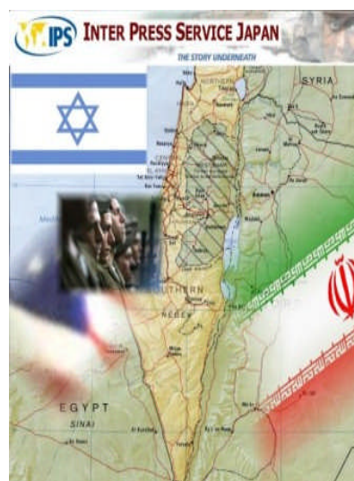
イスラエル

中東で唯一の核兵器国であり、200発の核を保有しているとされるイスラエルは、これまで一貫してNPTに署名することを拒んできた。