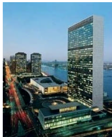
国際連合本部

同時に、フランス政府は、カタールとモロッコの原子力開発への支援を約束したと報じられている。エジプトとヨル