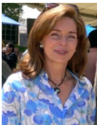
ヌール女王

他方で、アラブ同盟とアフリカ連合の両方の加盟国である10カ国が、2009年7月に発効したアフリカ非核地帯化条約（NWFZ：通称ペリンダバ条約）の加盟国となっている。アルジェリア、ジブチ、エジプト、リビア、モーリタニア、モロッコ、ソマリア、スーダン、チャド、チュニジアである。