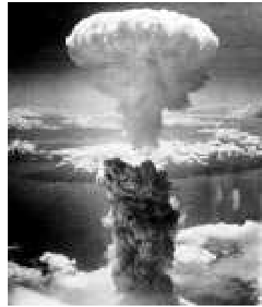
原爆のきのこ雲（長崎上空）

完璧なタイミングとみるか、それとも単なる歴史の偶然とみるか。イスラエルの核のハンマーとイランの核のハンマー台との間に挟まれた結果か、あるいは、彼らが真摯にそれを望んでいるためか。いずれにせよ、アラブ22カ国の首脳達が、世界から核兵器をなくすべきだとする、前例のない大きな緊急の呼びかけを行った。