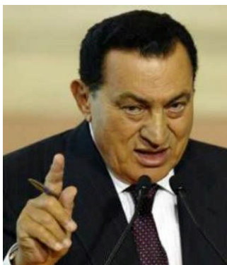
ホスニ・ムバラク大統領

中東非核地帯を目指すという目標は目新しいものではない。実際、エジプトは36年前、「中東非核地帯」の確立を目指した活発なキャンペーンを立ち上げている。